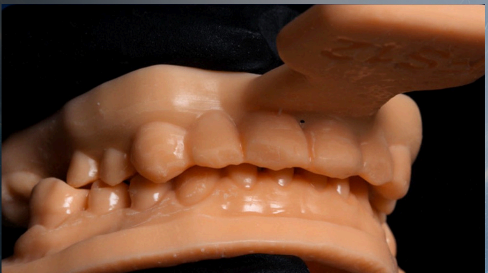
Transferência de DVO e registro oclusal